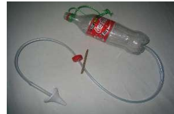
Ensemble complet avec réservoir